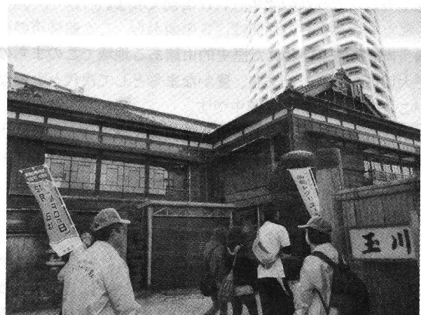
▲高層ビルを背景に、太宰治が執筆活動をした大正10年創業当時のままの建物「玉川旅館」