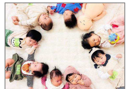
ベビーマッサージ 0歳の赤ちゃん

連合・愛のキャンパ助成事業 市原市社会福祉協議会 八千代市社会福祉協議会大和田支会 千児協主催乳児院合同