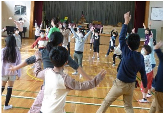
ミュージカルでオリジナルダンスをのびのびと踊り、はじけた。

コロナ禍での学校生活では遠足、運動会、校外学習、宿泊旅行などの学校行事が取りやめあるいは縮小され、卒業アルバム用の写真がなく困り、対応策として芸術家派遣事業をとりくむことになった。また小学校生活最後の学年思い出の一つとして、申し込みの理由を上げた学校が多数あった。6年生だけを対象にした学校は狂言、歌舞伎、落語、アフリカンパーカッション、パントマイムの分野へ31校あった。